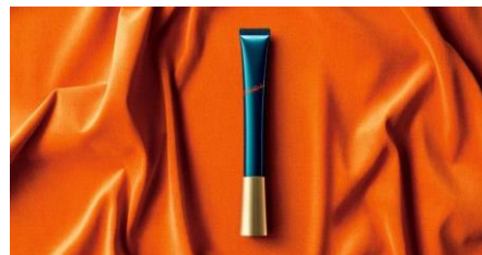
リンクルショット メディカル セラム®