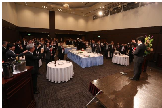
祝賀懇親会の様子