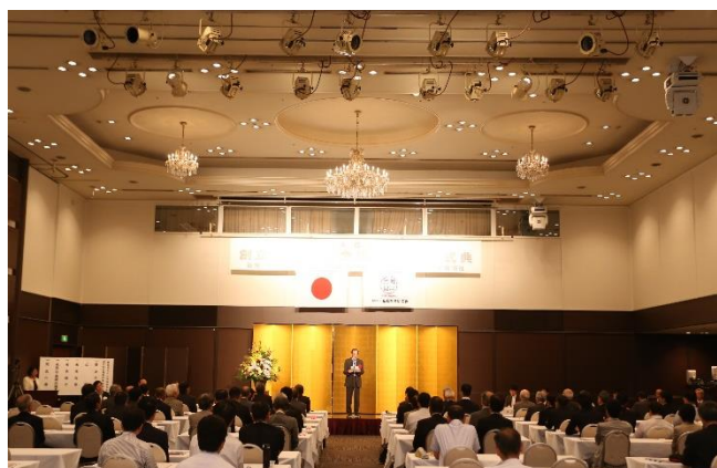
90周年記念式典の様子