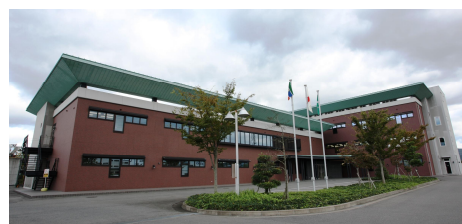
丸善製薬(株)総合研究所