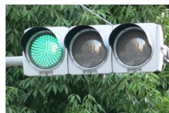
発光ダイオードを使った信号機