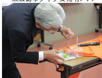
教材紹介 「からまり時計」