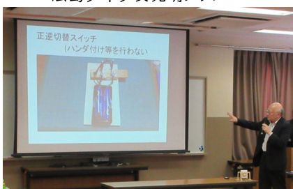
教材紹介 「二足歩行ロボットについて」