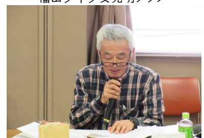
教材紹介 「ポンポン船」等